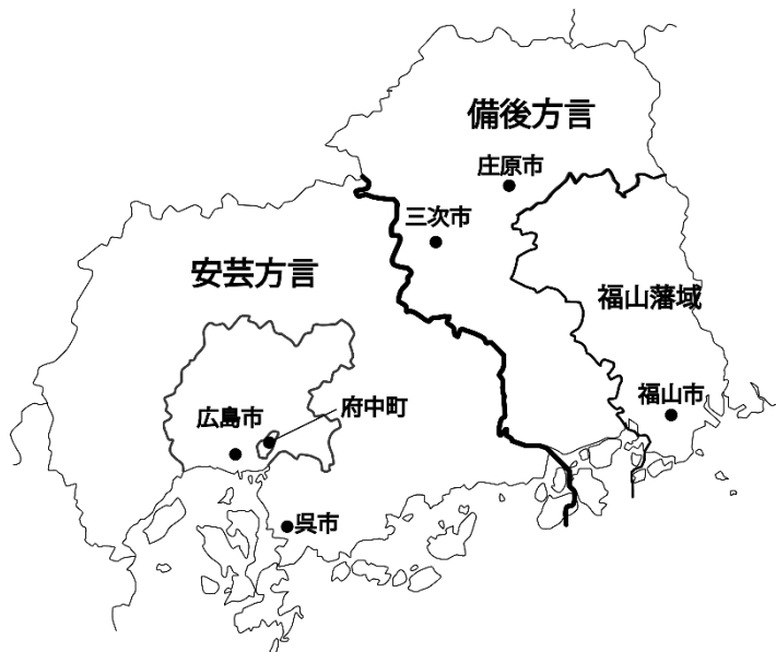
図1 広島県の方言区画と本研究の調査地点（小西 2017 の図をもとに改編）

本研究での調査対象地域は広島県安芸地域である。図1が調査対象地域を示したものである。主として広島市域と安芸郡府中町が調査対象地となる。当該地域は、安芸地域の政治・経済の中心地であり、安芸地方全体の言語変化を先導していると推測される。また、筆者自身がこの地域の出身であり、日常の言語コミュニケーションを通して本稿で扱う現象に気づいたことが本研究の背景となっている。