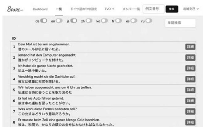
図2：例文一覧表示画面 独日2言語出力の場合

具体的には、作成例文をひとまずデータベースに登録し、図2のような例文一覧表示機能と図3のような各例文セットの表示・編集機能を付けた。