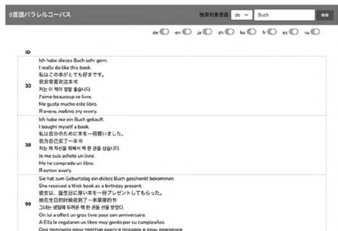
図1：検索例 ドイツ語のBuchで検索 8言語出力

これまで、個別言語のコーパスは、言語学習に利用される場合も、検索結果を十分に読解できる力を