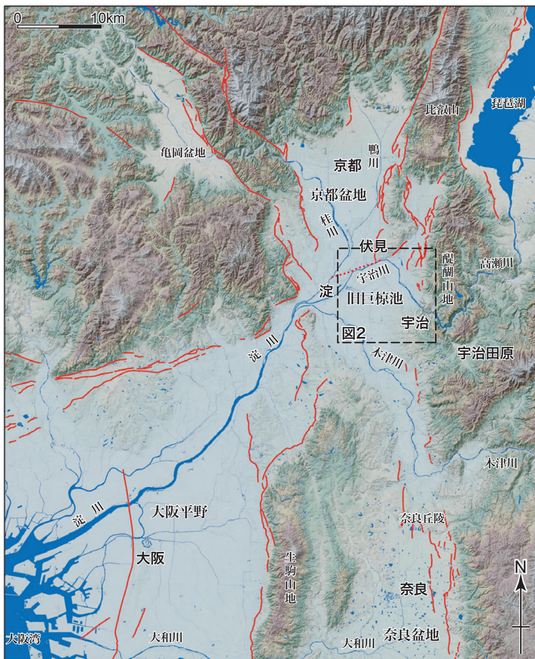
図1 対象地域周辺の地形

国土地理院基盤地図情報の数値標高モデル10mメッシュを用いて作成。活断層は中田・今泉編（2001）に一部加筆。