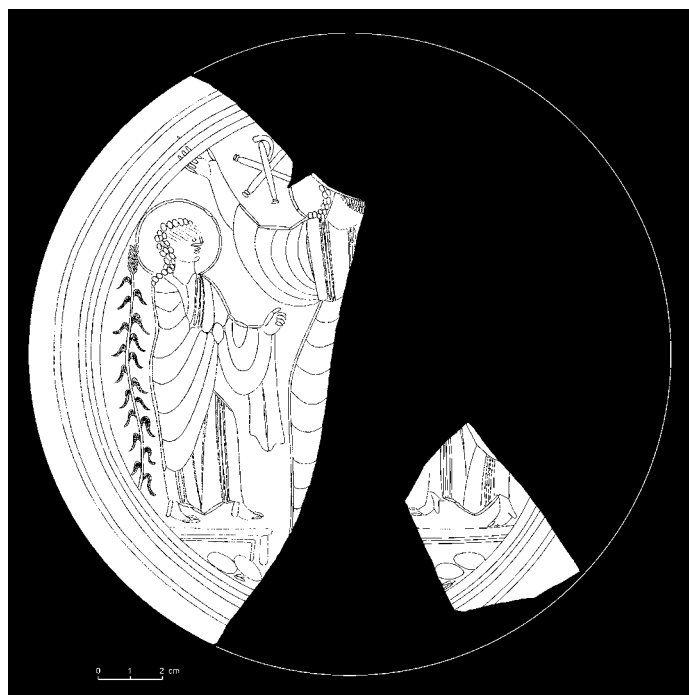
図3 「ボルトゥスのバシリカ出土、Musei Vaticani (Museo Cristiano inv. no. 60314-60315) による実測図」

キリストの頭部は欠けているが、顎鬚があり、肩までかかる長い髪に光背を有していたことはかろうじて確認できる。また光背に接するように、その右にはキリストの名を象徴するキーロー・モノグラムが配されている。右手は、右下の人物を称えるように高く掲げられ、条飾りの付いたトゥニカとパリウムを着用している。その右下の人物は、顔と足はキリストの方を向いた横向きで、身体は四分の三正面を向いて podium （基壇）に立っている。 podium の下には小石のような丸いものが散