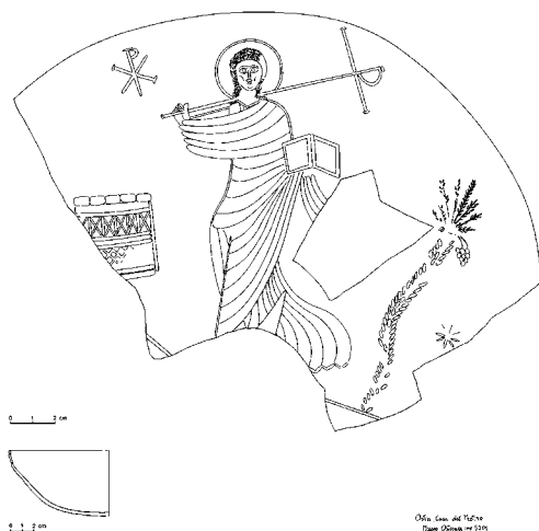
図1 「プロティロの邸宅出土,Museo Ostiense, inv. no. 5201 ©L. Saguiによる実測図」

淡い緑色がかった透明の浅碗。直径18cmの碗の上三分の二近くが残っているが、中央右側の一部欠損。高さ5.6cm。口縁の下に三本の刻線。碗を内側からみると、その中央には、正面を向き、右手でキーロー・モノグラム付きの長い柄の十字架を肩に担ぎ、左手には開いた冊子本(または二枚折書字板 diptych )を持ち、頭に光背をいただいた長髪無髭の人物が左足を一步前(向かって左)に進めている。その身体は長衣で覆われているが、右手首にかけたパリウム?の裾を右へ、左手首にかけた長衣の裾を左へと、それぞれ逆方向に引っ張っているため、ゆったりした衣服であるにも関わらず、「陰刻」工房が特異とする幾重にもよった襷がその華奢な身体ラインを示しつつ立体感を出している。人物の足元は欠損のため不明。人物の左側には、たわわに実をつけたナツメヤシの木が一本と、さらにその左に星のような印が、人物の右側には、二段の異なる編込み模様を見せる方形―または円筒形の