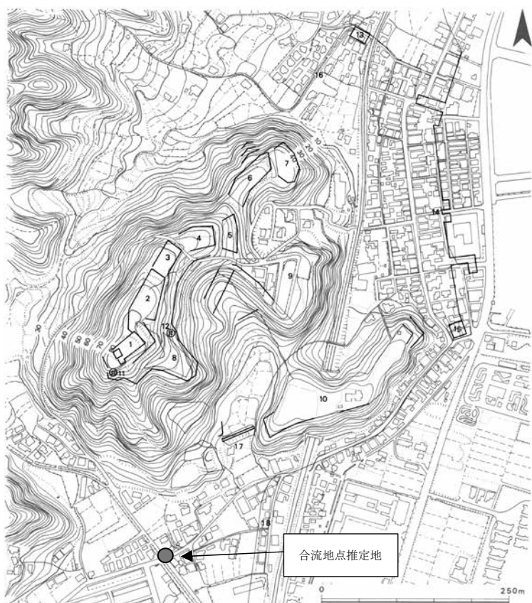
第4図 亀居城全体図 (1:5,000)

先述のように「小方村国郡誌」では、亀居城築造時に百姓たちが「卸場」に居住していたとされている。まず、この「卸