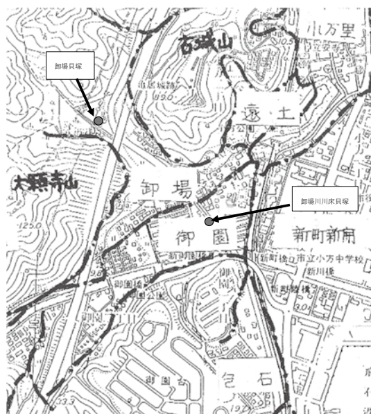
図3 小方地区字名図

園地区に中世期の貝塚が確認されている。「広島県遺跡地図」より関係する部分を抜粋し表1として掲載するとともに、それぞれの貝塚の位置を図3に示した。表1を見ると、遺跡からは貝殻の他に土器や磁器、石器や土鍾といった生活廃棄物が出土していることが分かる。 ⑩ 通常、こういった貝塚（ゴミ捨て場）は居住空間に近接し、なおかつ耕作等に利用できない場所に形成されるものである。両貝塚とも卸場地区の周縁部に位置しているため、卸場地区に集落があったと推定しても不自然ではないと考えられる。