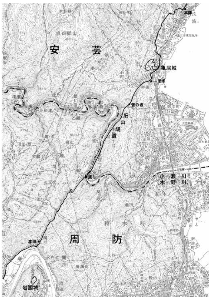
第2図 亀居城周辺地形図（1：50,000 大竹）