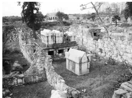
図2 埋葬複合体 (Com. 2) (壁に囲まれた空間：前方に石棺、 後方に納骨堂・納骨室、その上に石棺)