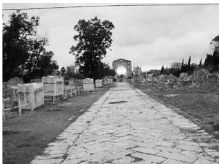
図1 アル＝バース・サイト (前方に都市門、両側にネクロポリス)

以上が筆者による検討の要約であるが、その論考の刊行後、考古学的情報を軸とする他のアル＝バース・ネクロポリス研究が存在していることを知った。それは de Jong の2010年の論考で、Maurice Chéhab による4巻本のアル＝バース・ネクロポリス発掘報告書 (9) を分析、再構成したものである。無論筆者も発掘報告書に注目していたが、レバノン内戦の混乱のために重要情報（例えば体系的なアル＝バース・ネクロポリスプラン、層位情報、土器実測図）が失われ、収録されておらず、体系的なその分析は途上であった。ところが de Jong は、発掘報告書などに記された座標やわずかな平面図、そして衛星写真と空中写真を駆使し、暫定的ではあるが見事にアル＝バース・ネクロポリスプラン（図3）を、さらには発掘報告書などの遺構や遺物情報（ガラス器実測図、埋葬施設、碑文、わずかな層位情報）を利用して、少なくとも3つの段階 (10) からなるアル＝バース・ネクロポリスの発展を提示している。そして、シリアにおけるローマ以前の政治的構造（地方王国、都市国家など）が終焉しローマ属州行政への統合されていく社会的変化のなか、アル＝バー