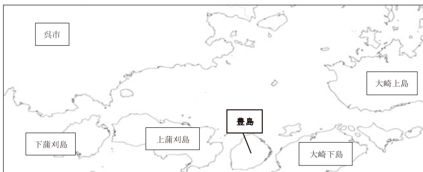
図1 広島県呉市豊浜町豊島の位置

広島県呉市に属する豊島は、 とよしま 上蒲刈島と かみかまがりじま 大崎上島と おおさきしもじま 大崎下島の間に位置する。図1に地図 5 を示す。