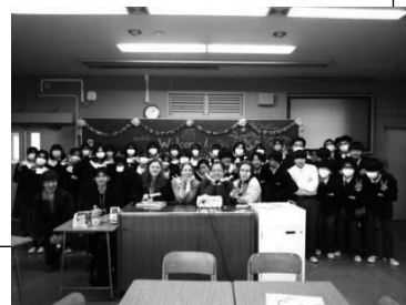
表 3. クラス交流 (各クラスにおける日本文化紹介と留学生の実践プロジェクト)